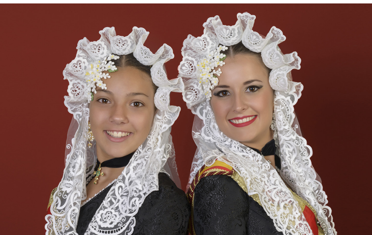
Figura importante en la fiesta de Fallas, los cargos falleros representan a cada distrito fallero, así como las Falleras Mayores de Elda y su Damas de Honor, son las únicas representantes que la ciudad de Elda y su Fallas tienen.